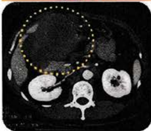
一年前，馮太的腹部腫瘤十分巨大，有近十八厘米，非常危險。