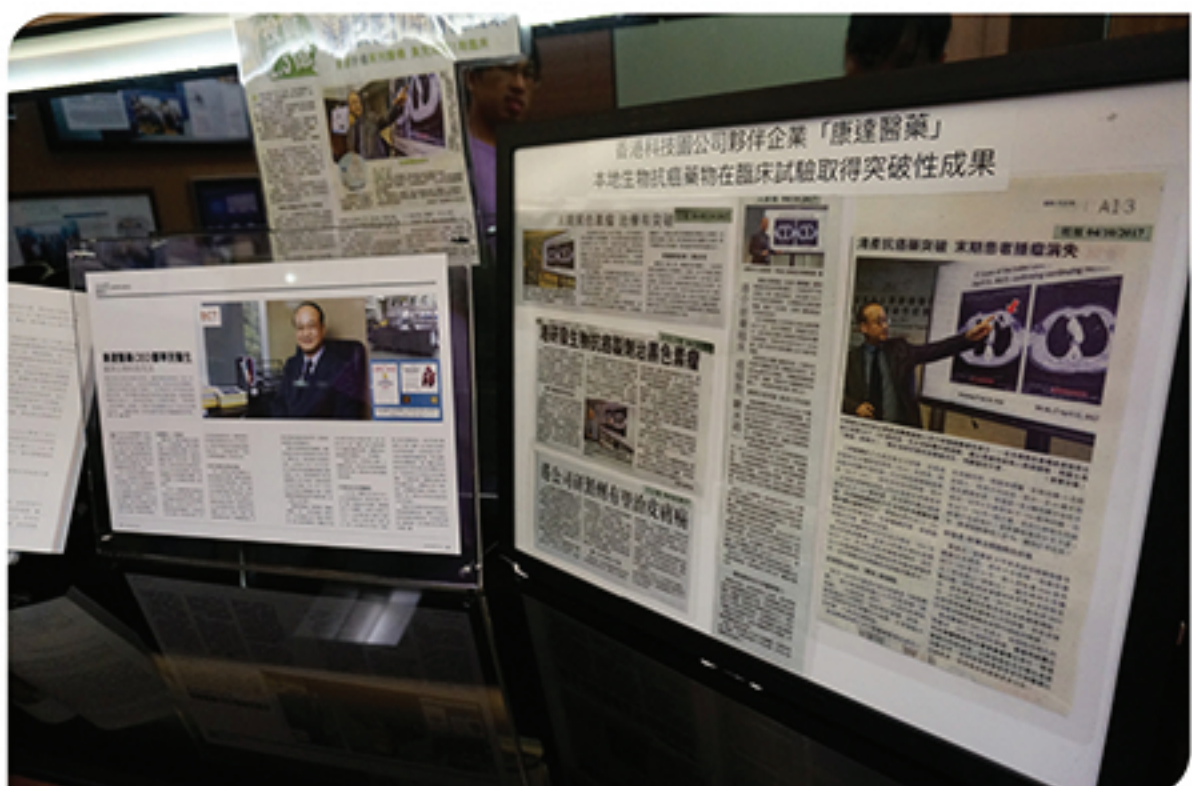
BCT-100是本地首隻生物抗癌藥，難怪引來一眾傳媒採訪。

要維持下去，康達醫藥必須集資上市。鄭醫生表示，現時有數個投資方案，除了科學園，還有不同投資者參與，已有足夠彈藥展開下一輪研究。「繼BCT-100後，我們正在研發第二三種發明，希望可以分散投資。」鄭醫生說，18年當中，許多辛酸，亦曾絕望過。「但現在已看到轉機。」