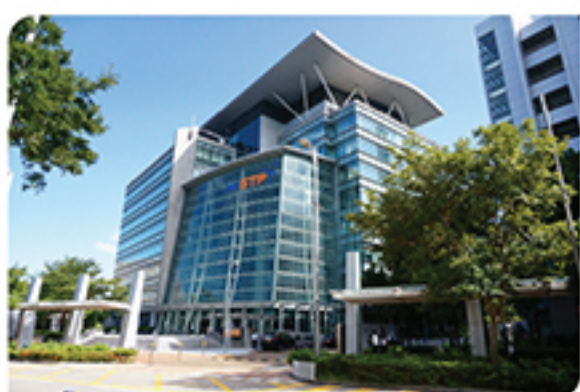
2007年，康達醫藥進駐科學園，研究團隊既可使用生物醫藥科技支援中心的種種設施，亦能拓展人脈。